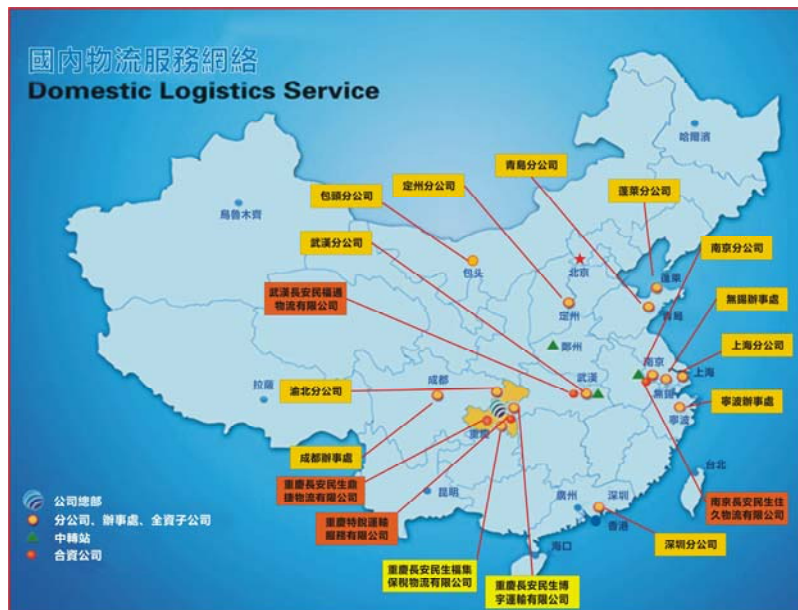
圖二：公司目前的分支機構分佈圖

為完善並擴大服務網路，提高服務能力，本公司強化了分支機構的建設，並通過有效利用資訊技術系統的手段對各分支機構實施科學管理。截至 2010 年 12 月 31 日止，本公司累計建立分公司、子公司、聯營企業和辦事處 18 個，主要分佈在華東、華中、華北、華南和西南地區（圖二）。不斷完善的服務網路，令本集團能提供物流服務至全國各地。